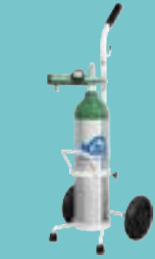
Tanque de oxígeno portátil