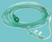
Cánula nasal acorde a edad del paciente