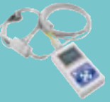
Saturador de oxígeno